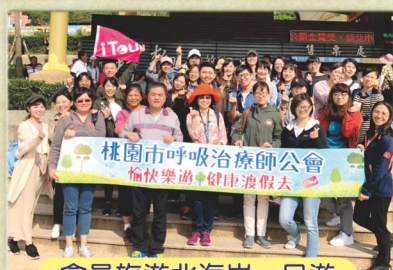
會員旅遊北海岸一日遊