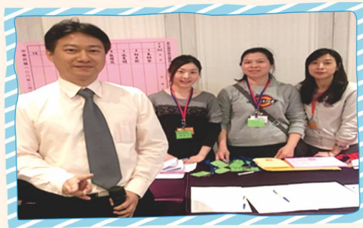
第五屆第三次會員大會辛苦的理監事們及秘書