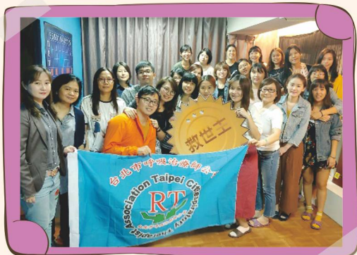
107年度秋季旅遊活動照片