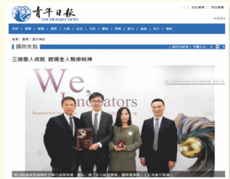
圖一：第十四屆新創獎頒獎典禮

在現今求新求變的時代，個人認為在呼吸治療領域中，白色巨塔內調整呼吸器只是其中一隅，在白色巨塔外的廣闊天地，應可開拓嶄新視野。隨著人口高齡化及空污嚴重呼吸治療需求湧現，其呼吸治療醫療器材的創新，更是一片藍海，在將構想、創意全都變現之前，首先要將專長、技能加以整合增強自己的專業價值，才能創造屬於自己的斜槓人生。