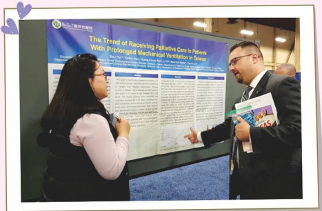
AARC 2018 Open Forum Participant