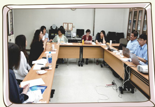
全聯會-「衛生福利部長照服務發展 獎助作業-CA07呼吸照護試辦計畫」 ：108.04.25