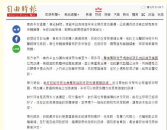
圖二：以新創產品介入呼吸訓練