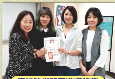
實證醫學競賽榮獲銀獎