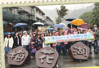
會員旅遊宜蘭愜意DIY一日遊