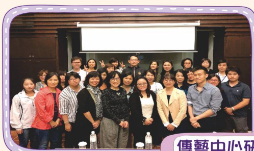
傳藝中心研討會課程花絮