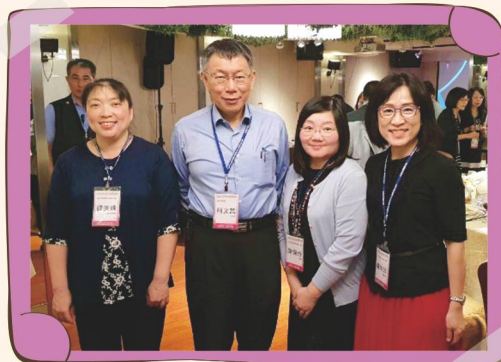
醫事聯誼會與市長合影