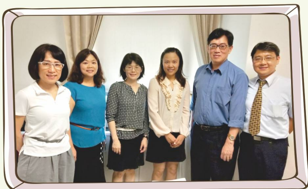
拜會衛生福利部長照服務司：討論長期 照顧之專業服務給付及支付基準呼吸 護理品項試辦計畫：108.05.16