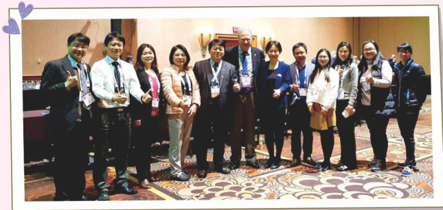
2018 International Council for Respiratory Care, ICRC