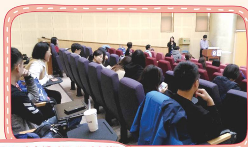
107年度會員大會暨研討會課程花絮