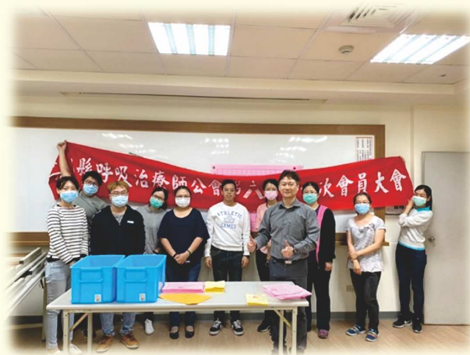
第六屆第一次會員大會