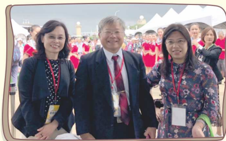
桃園農博開幕典禮

二、109年06月13日舉辦第五屆第三次會員大會，地點：林口長庚兒童大樓12K第三會議室。為因應Covid19疫情，最新動態將發佈公會網頁上，請會員密切關注。