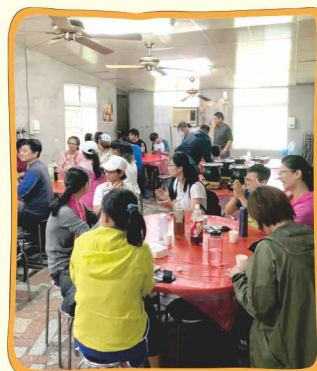
運動完要補充蛋白質