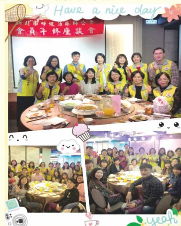
108年11月30日公會年終座談會