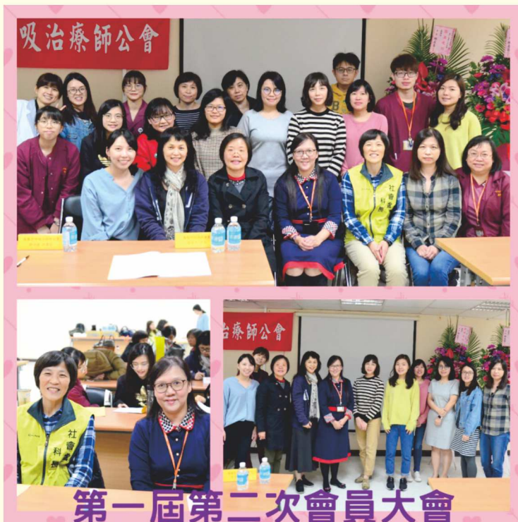
第一屆第二次會員大會