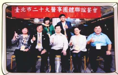
出席台北市牙醫師公會聯席餐會