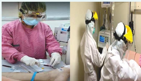
圖三、四：抽取動脈血及調整呼吸器設定