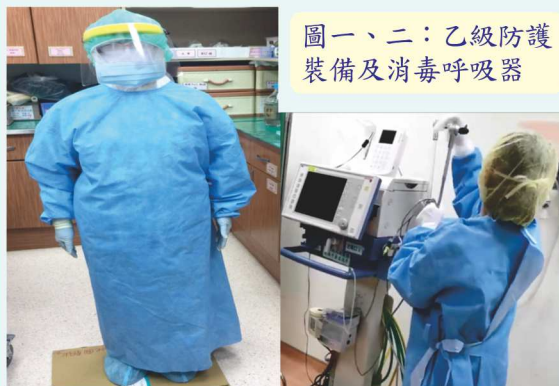
圖一、二：乙級防護裝備及消毒呼吸器