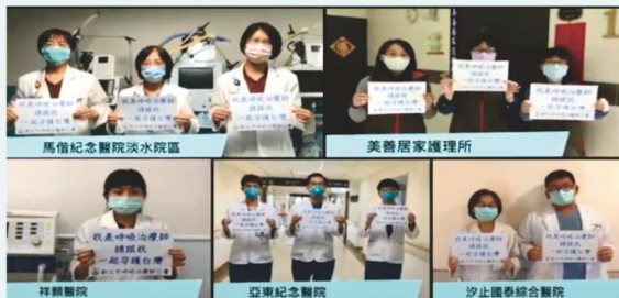
圖八：畫面來源-「新冠肺炎防疫最前線-呼吸治療師」新北市呼吸治療師公會防疫影片