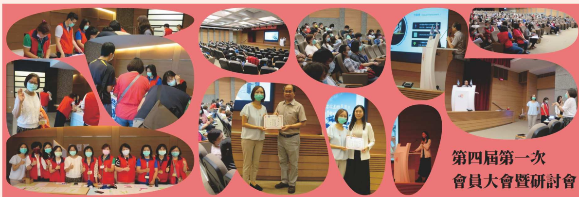
第四屆第一次會員大會暨研討會