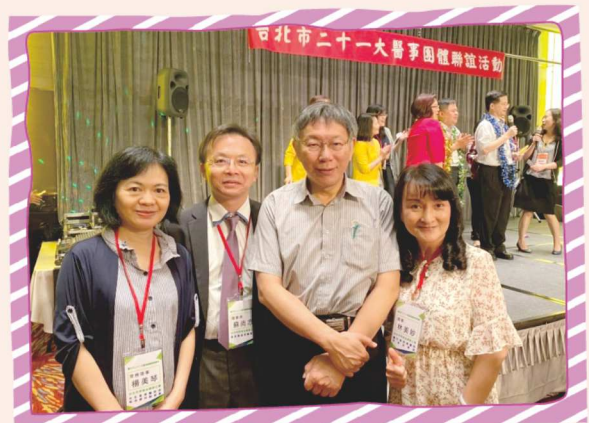
出席台北市護理師公會聯席餐會合影