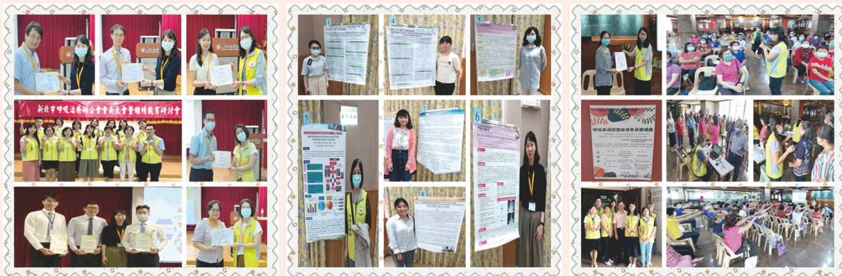
109年08月22日會員大會暨研討會暨海報發表 感謝各會員參與、講師精彩課程及廠商們的共襄盛舉