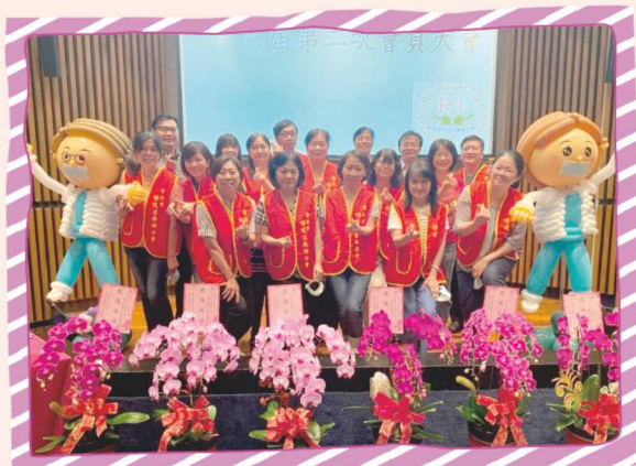
109年9月19日會員大會暨倫理法規研討會合影