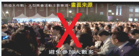
防疫大作戰 - 大型集會活動注意事項 - 畫面來源