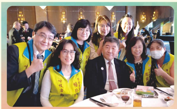
展望2022總盟聯合感恩餐會