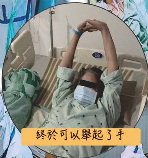
終於可以舉起了手