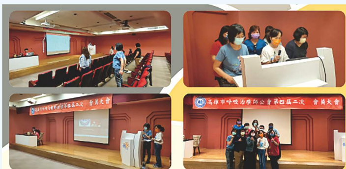
高雄市呼吸治療師公會110年會員大會暨學術研討會直播現場