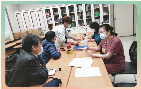
第五、六屆會務移交