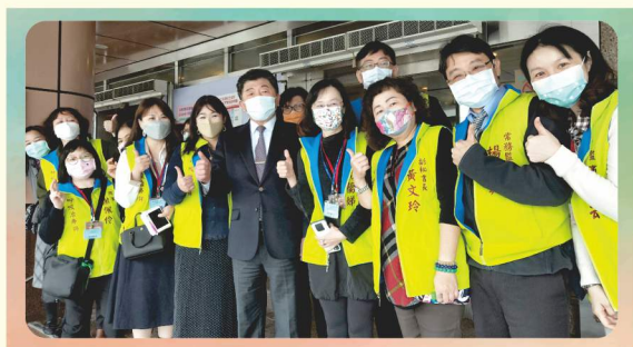
陳時中部長蒞臨合影