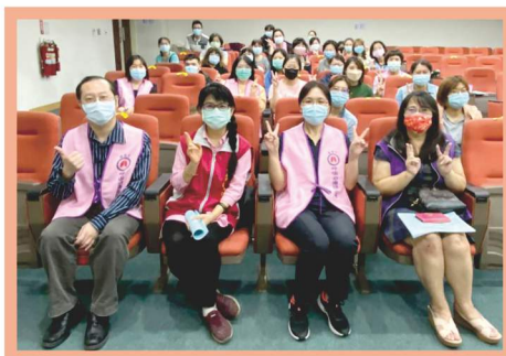
第五屆第三次會員大會