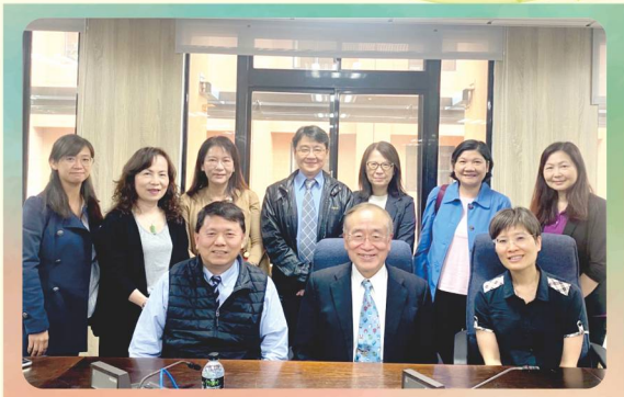
考選部-召開「研商專門職業及技術人員高等考試呼吸治療師考試實習認定基準」會議