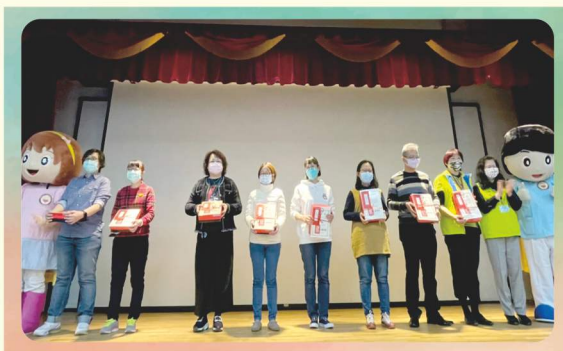
資深呼吸治療師表揚