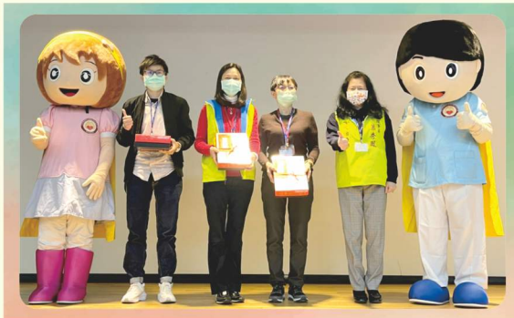
優良呼吸治療師表揚