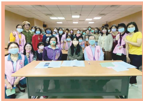
第六屆第一次會員大會