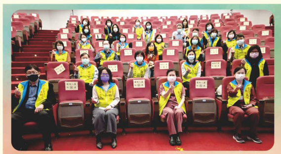
第五屆第十四次理監事會