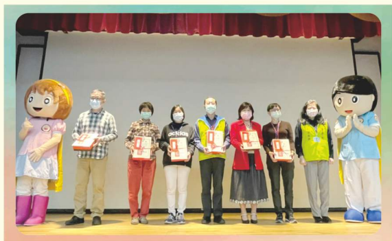
典範呼吸治療師表揚