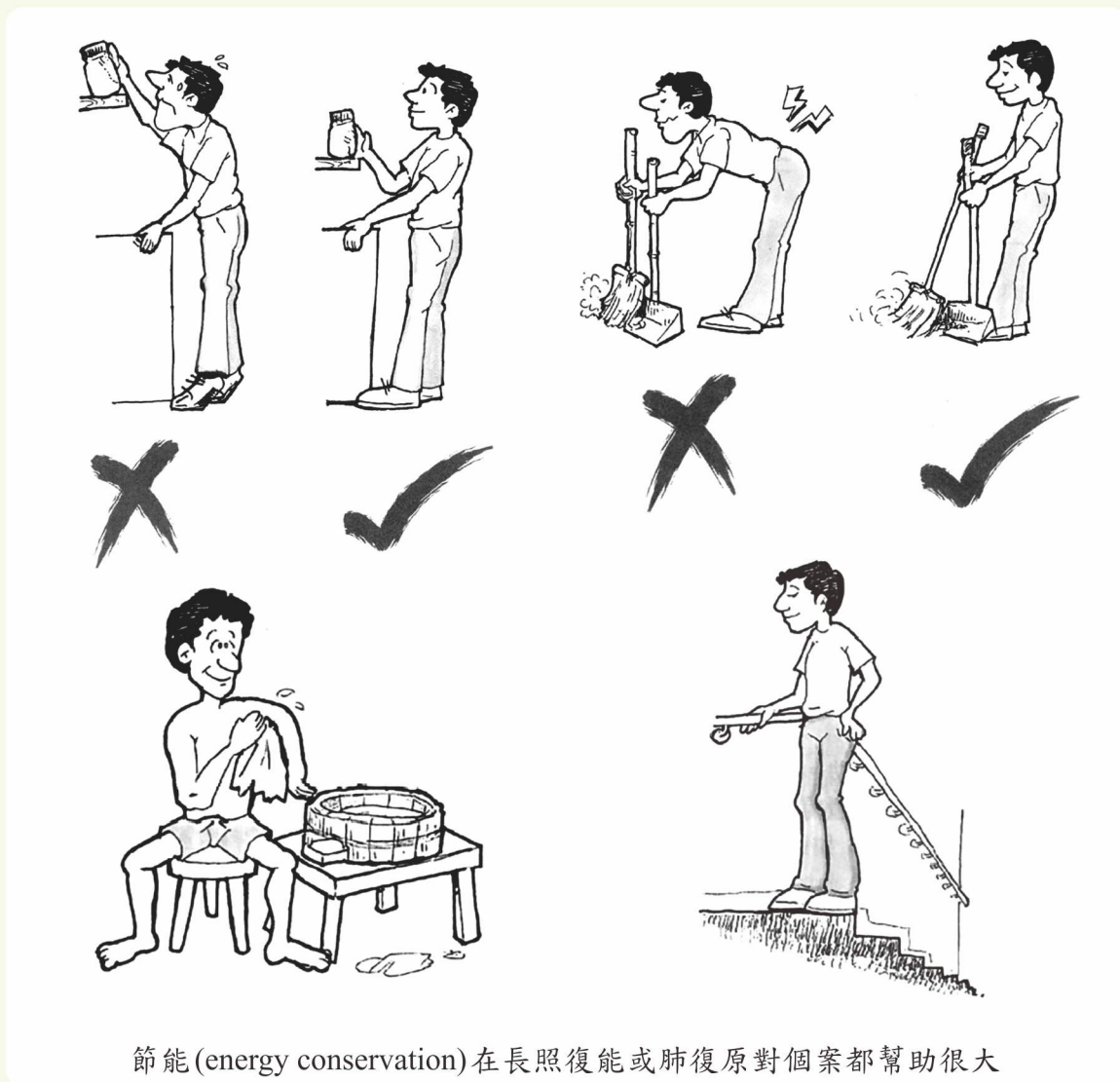
節能(energy conservation)在長照復能或肺復原對個案都幫助很大

衛福部長照司明確規定每次復能（指導）時間至少40分鐘以上，一週只能執行一次復能，執行第三次復能前需把復能計畫書給A單位個管師列管追蹤。呼吸治療師在長照專業復能仍有很大的發揮空間，透過跨專業學習與經驗分享除了也可學到各職類不同的專業面，也可以讓長照各職類人員知道若遇到有類似的個案可轉介給呼吸治療師。