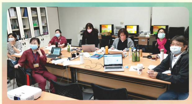
EPAs推動任務小組委員第2屆第4次會議