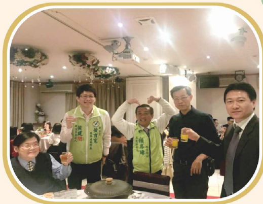
彰化縣呼吸治療師公會第五屆第二次會員大會彰化縣衛生局 葉局長彥伯蒞臨及彰化縣賴岸璋議員參與