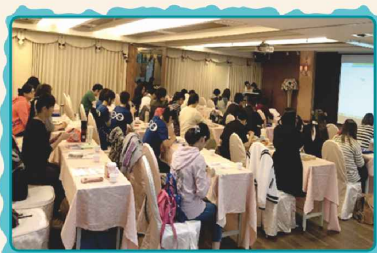
會員大會暨研討會上課情形