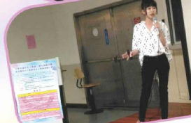
~2018呼吸治療師演講比賽。感謝名路參賽者。讓活動更加精采~