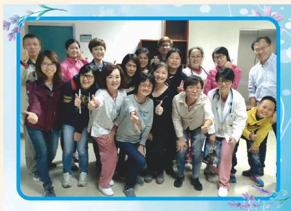
第二屆理監事合影