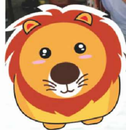
106年公會日月潭一日遊