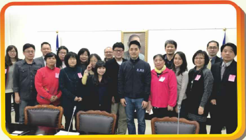
1/9-配合參與營養師應考資格恢復學分制乙事拜會蔣萬安立委