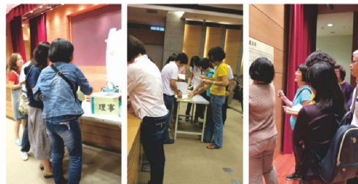
第三屆理監事選舉