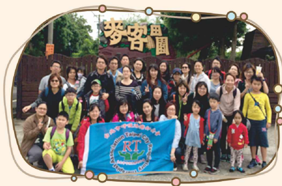
106年度秋季旅遊活動照片