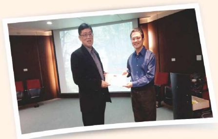
理事長致贈講師感謝狀