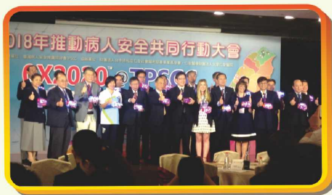
4/21：仁愛基金會-2018年推動病人安全共同行動大會