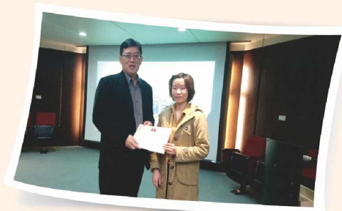
理事長致贈講師感謝狀