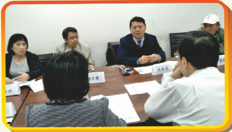
1/23：林靜儀立委辦公室－呼吸治療納入照顧清單及居家呼吸照護所設立問題