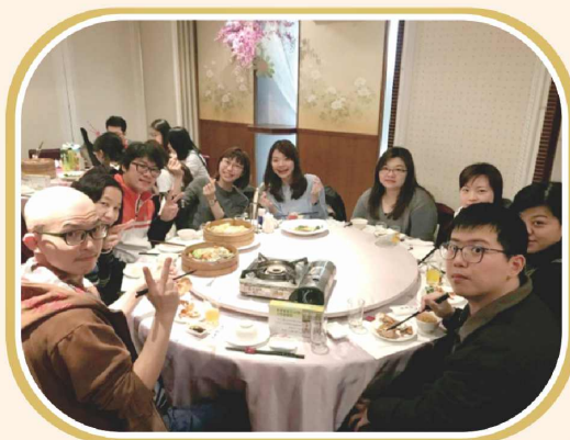
彰化縣呼吸治療師公會第五屆第二次會員大會會員踴躍參加圓滿結束