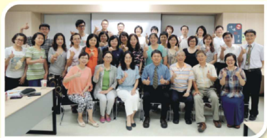
地方公會及學系座談會系列(一)： 台北市、新北市公會