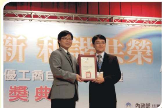
本會 104 年評鑑甲等