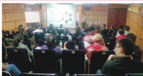
宜蘭縣呼吸治療師公會理監事會議暨大會