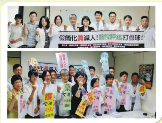
9/23：醫改會-如果把人力標準從醫院評鑑基準拿掉會對該職類產生什麼樣的影響記者會