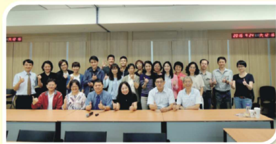
地方公會及學系座談會系列(二)： 桃園市公會