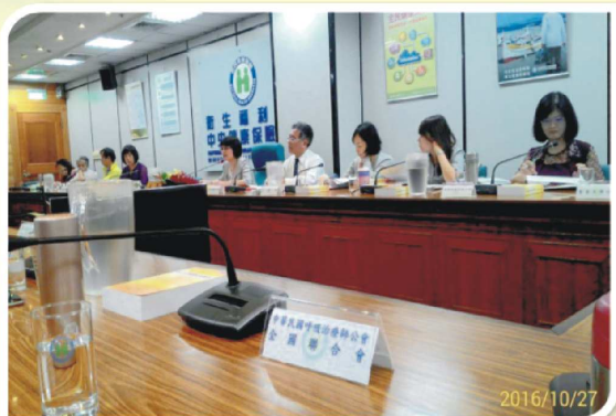
10/27：健保署-「全民健康保險慢性阻塞性肺病醫療給付改善方案(草案)」討論會