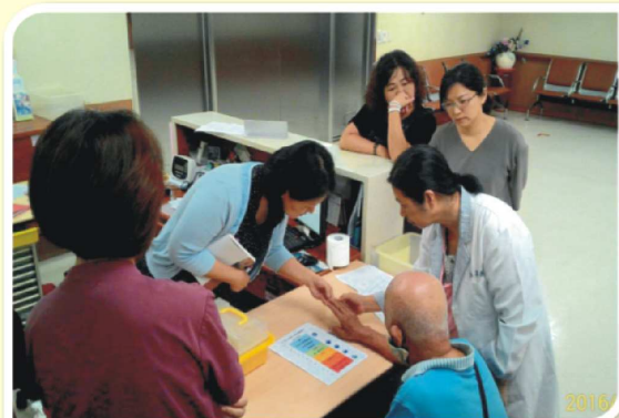
11/18：長照委員會第4-1次開會，討論商議本屆工作分配及COPD送件資料