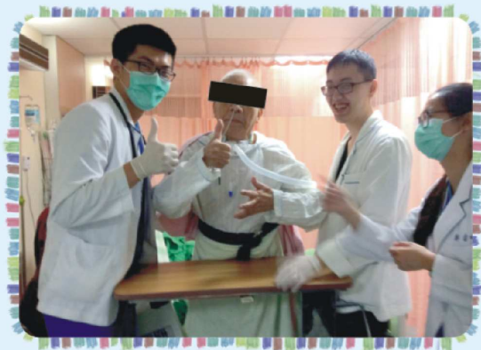
圖四.實際技術操作情形