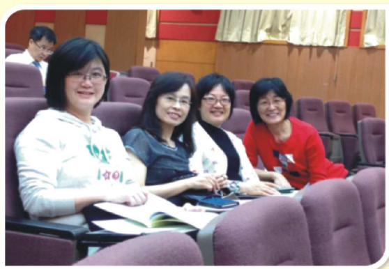
11/27：北醫-慢性阻塞肺病臨床治療指引權益關係人說明會