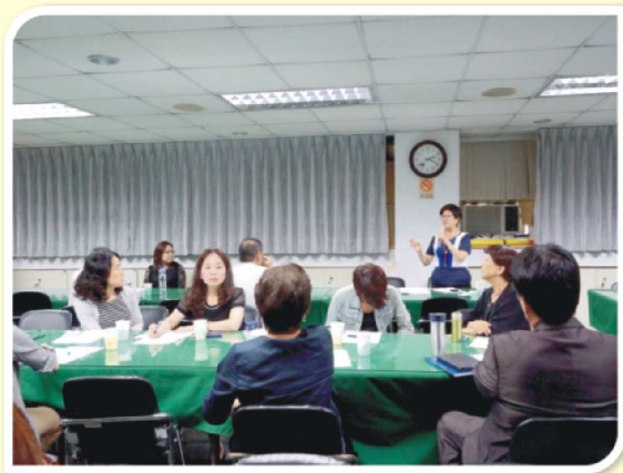
10/6：醫聯盟-醫院評鑑假簡化、真減人會議