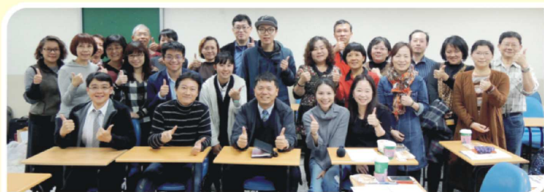
地方公會及學系座談會系列(三)：台中市公會、彰化縣公會