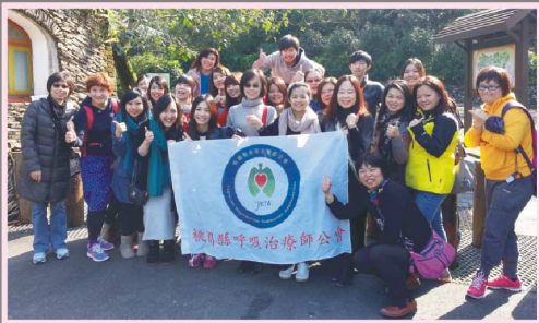
宜蘭福山植物園一日遊

二、103年6月舉辦單身聯誼交流會，詳細活動內容將預告於公會網站，歡迎報名參加。