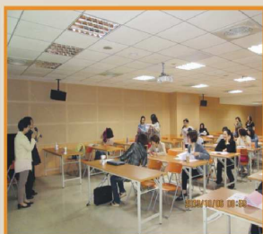
專業及倫理研討會 活動花絮