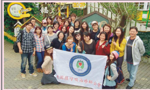
宜蘭福山植物園一日遊