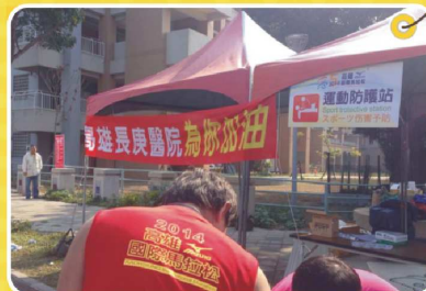
20公里處長庚防護站，倍感溫馨