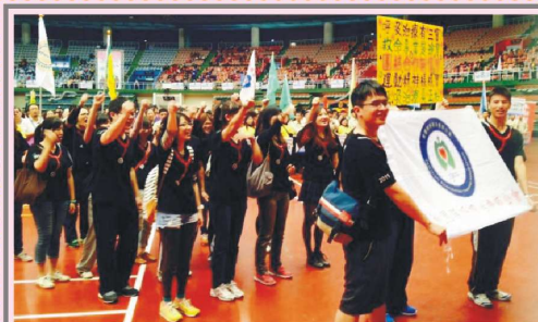
衛生盃運動大會活動