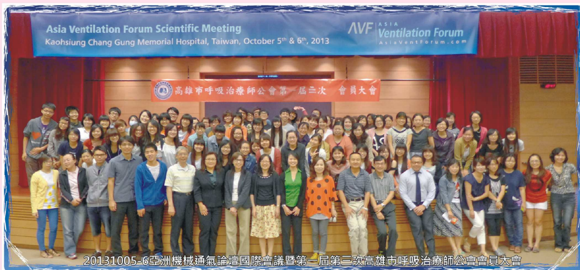
參加亞洲機械通氣論壇國際會議暨第一屆第三次高雄市呼吸治療師公會會員大會之來賓合影於星光廳