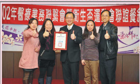
102年醫療業務聯繫會暨 衛生盃運動會聯誼餐敘