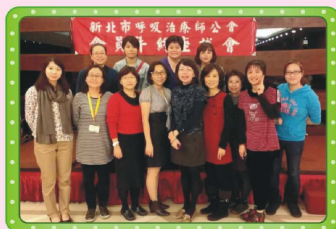
102年12月7日會員年終座談會