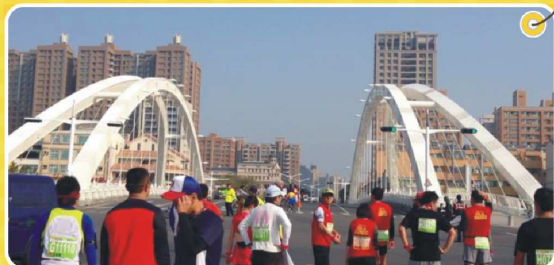
高雄夜景新地標—願景橋

想起為了練跑推掉邀約，想起因偷懶怠惰深深內咎、想起寒流來襲仍一起練跑的夥伴，謝謝每一位陪我從零開始的朋友，在我懶散失去鬥志時不斷鼓勵著，一同前進不曾放棄。期許自己能日日實踐馬拉松精神—堅持到底、努力不懈，向下一個里程碑前進。