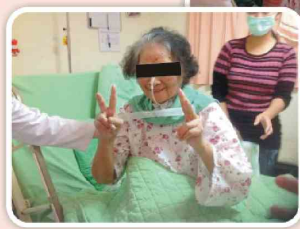
陪爺爺、奶奶外出散心