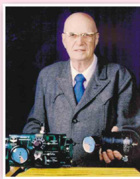
Bird Mark 7和它的原型機