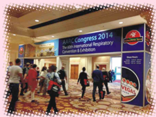
AARC展場入口，與會者熙來攘往

今年度我向AARC投稿一篇個案報告的海報，主辦單位要求發表者要在參展當天的中午，需在海報旁站90分鐘接受提問。當時我心想中午時分，大家經過一個早上的腦力激盪，肚子餓得受不了，廠商的餐會又如此豐盛，究竟誰會來看海報呢？心底正在嘀咕，此時看見其他的海報發表者紛紛就位，無一從缺。90分鐘的時間，看見許多來自各地的會員，站在海報前聚精會神，眼神銳利如雷射刀掃視著，令人心跳加速、手掌發汗。與其說提問，我想「交流」會更加的確切。會員們分享著自家醫院的做法，對彼此的差異討論著，並給予寶貴的建議與更多的鼓勵。大家自發性學習，認真的態度神情與精神，強悍有力的扭開了我的視野，並震撼了我的心。在這裡看見許多呼吸治療界的前輩們發光發熱，自己也會更加的努力，期許未來也可以有一點小小的成就。