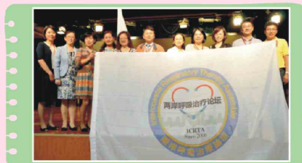
兩岸呼吸治療論壇會旗