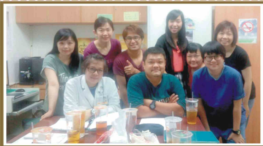
攝於慈院呼吸治療組辦公室