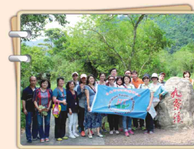
104年度秋季旅遊宜蘭之旅合影