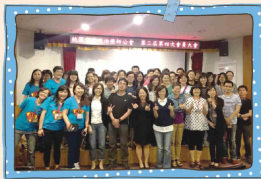
桃園市呼吸治療師公會104年度會員大會