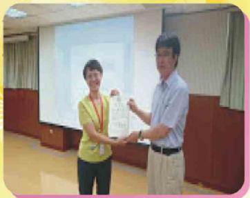
104年6月27日醫療倫理暨重症進階研討會活動照片