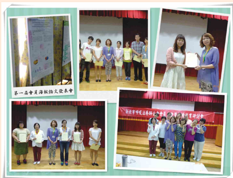
104年06月13日會員大會暨研討會感謝各會員參與及講師精彩課程