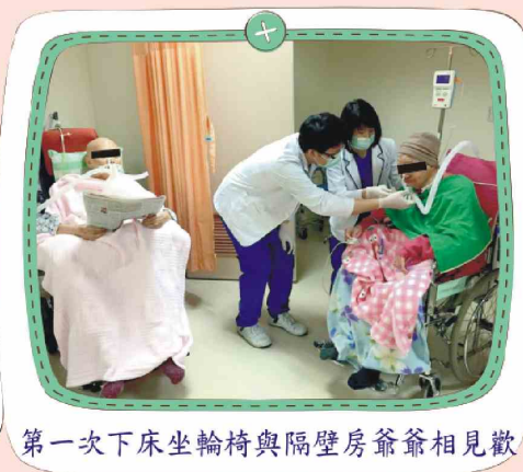
第一次下床坐輪椅與隔壁房爺爺相見歡