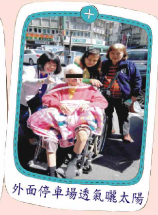
外面停車場透氣曬太陽