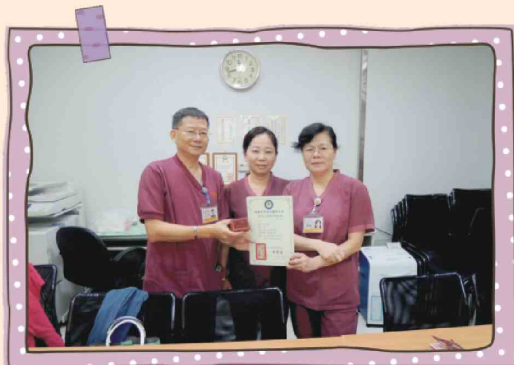
104年07月08日第三屆交接第四屆理監事暨第四屆第二次理監事聯席會議