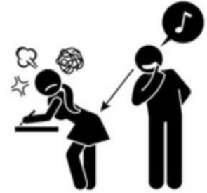
Verbal abuse and jokes