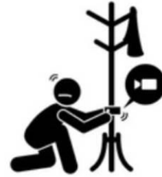
Installing Hidden Camera