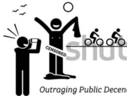
Outraging Public Decency