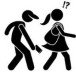
Taking Upskirt Video