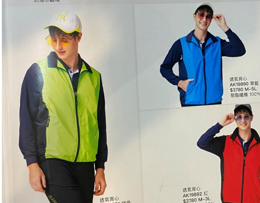
透氣背心 AK19891 綠色