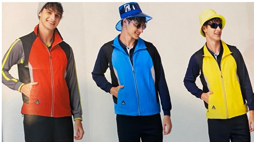
單面穿透氣背心 AK18862 紅/灰/黑 $3780 S-3L 聚酯纖維 100% 防潑水處理