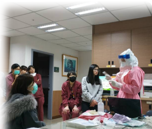
因應防疫措施 加強全員PPE之訓練