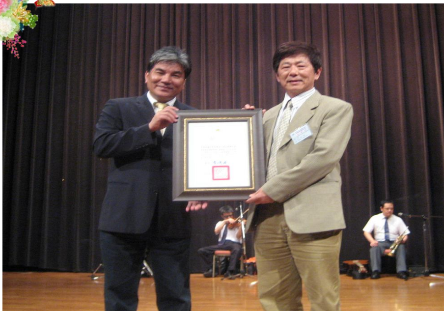
評鑑 99 年度(100 年頒獎)