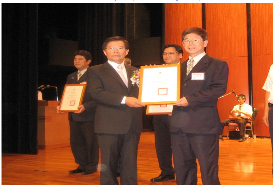
評鑑 98 年度(99 年頒獎)